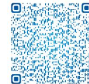
冰冻切片操作视频