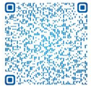
细胞爬片操作视频