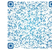
石蜡切片操作视频